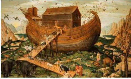
L'Arche de Noé sur le Mont Ararat, Simon de Myle (1570)

A l'image de Noé et de son arche, nous allons devoir emporter avec nous des êtres vivants nécessaires à notre survie sur Mars. Mais s'il avait été réel, Noé aurait rencontré bien des difficultés avec son arche tant le nombre d'espèces d'êtres vivants existantes à la surface du globe est immense. Avant de savoir quels êtres vivants vont nous accompagner sur Mars, nous devons mettre un peu d'ordre chez les êtres vivants.